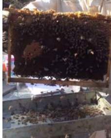
Photo 2 - Les abeilles sont secouées dans le toit de la ruche. <<<<<<