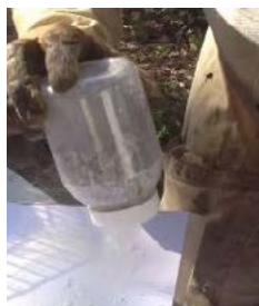
Photo 6 - Le prélèvement est secoué au-dessus d'un support blanc. <<<<<<