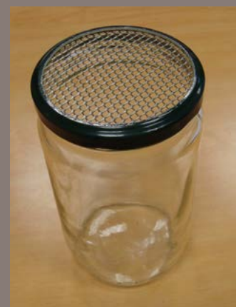
Photo 1 - Pot « shaker » utilisé pour traiter le prélèvement d'abeilles.