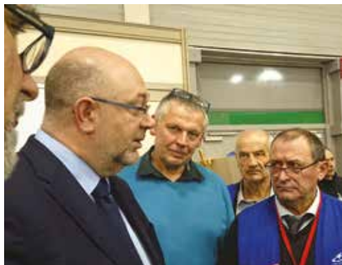
Un dialogue permanent avec le Ministère.

Les droits de tirage sur les réserves départementales du FMGDS permettent les actions collectives en matière de BVD, IBR, Paratuberculose, Border Disease, Neosporose. Près de 3 millions d'euros ont été débloqués depuis 2015, sur des projets validés par le CA du FMGDS.