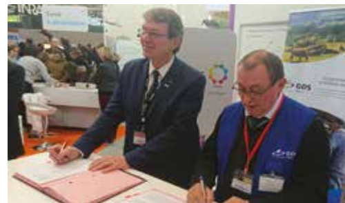
Signature convention entre GDSFrance et ANSES au salon