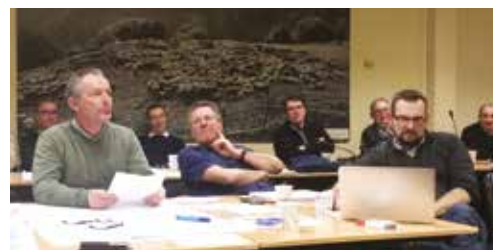
Mise au point du Contrat d'Objectifs de GDSFrance.

Le BEA au centre de la journée nationale de septembre, montrant l'implication de GDSFrance au sein de ce forum rassemblant professionnels, associations, chercheurs, hommes de culture. Il s'agit d'échanger pour rester en phase avec nos concitoyens et lutter contre l'approche extrémiste des abolitionnistes de l'élevage.