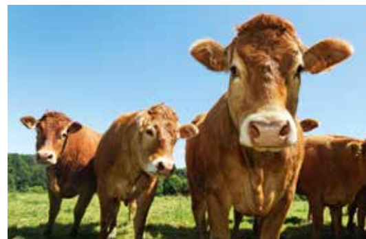
Le programme d'échantillonnage bénéficie de l'appui de France Limousin Sélection et de Races de France.

Le programme associant Inra-Allice-Apigènes - GDSFrance et les GDS du Grand Ouest recherche les liens entre génétique et sensibilité à la Paratuberculose. Un investissement conséquent des différents acteurs qui porte ses premiers fruits.