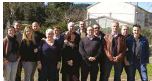
Fin du Tour des Régions à Bastia.

Il s'agit d'une instance du réseau constituée d'Élus et de Directeurs. Dans le cadre des missions déléguées et celles confiées à l'OVS elle intervient dans des situations sensibles où l'impartialité des salariés et/ou de la structure est remise en cause et qui n'ont pu être gérées localement.