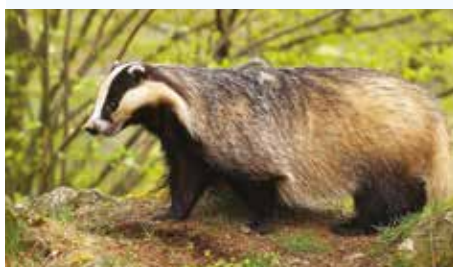
La faune sauvage: réservoir et contamination.