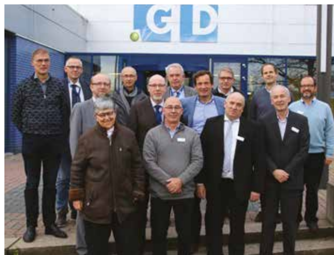
Séminaire FESASS à Deventer aux Pays-Bas.