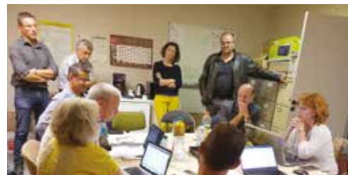
Processus d'accréditation en Pays-de-Loire

Les dossiers sont traités en commissions issues des régions qui peuvent s'adjoindre des groupes de travail techniques, avant d'être présentés en bureau pour validation en Conseil d'Administration. Un processus qui garantit une liaison permanente avec les besoins des GDS.